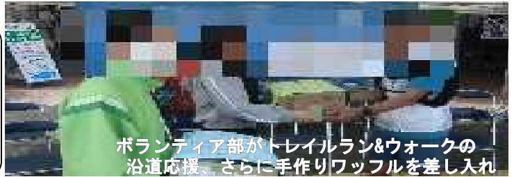
ボランティア部がトレイルラン&ウォークの沿道応援、さらに手作りワッフルを差し入れ