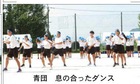
青団 息の合ったダンス