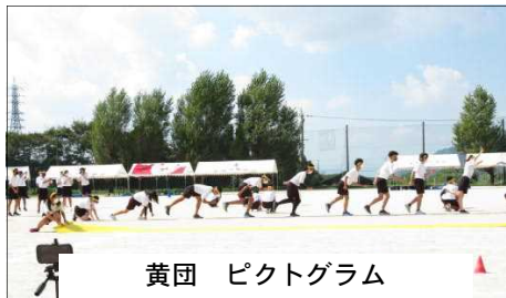
黄団 ピクトグラム

その後の縦割り団による「Rah! Rah!タイム」では、黄団のピクトグラム、赤団の小旗、青団のダンス、白団のストーリー性ある演出など、各団の個性あふれるパフォーマンスに、会場が温かい声援と笑いに包み込まれました。どの場面でも、生徒たちの、精一杯力を出し切る清々しい姿と、満足した顔が見られ、思い出に残る一日となりました。