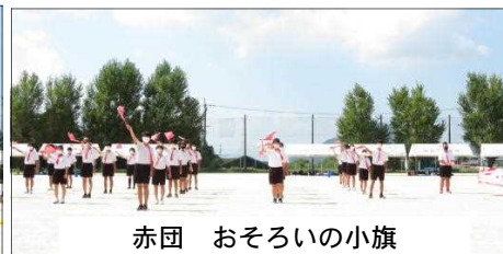
赤団 おそろいの小旗